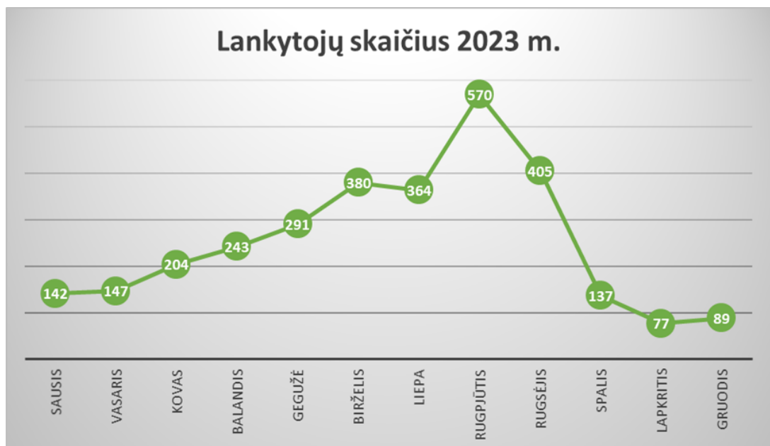
Diagrama. Lankytojų skaičius pagal mėnesius